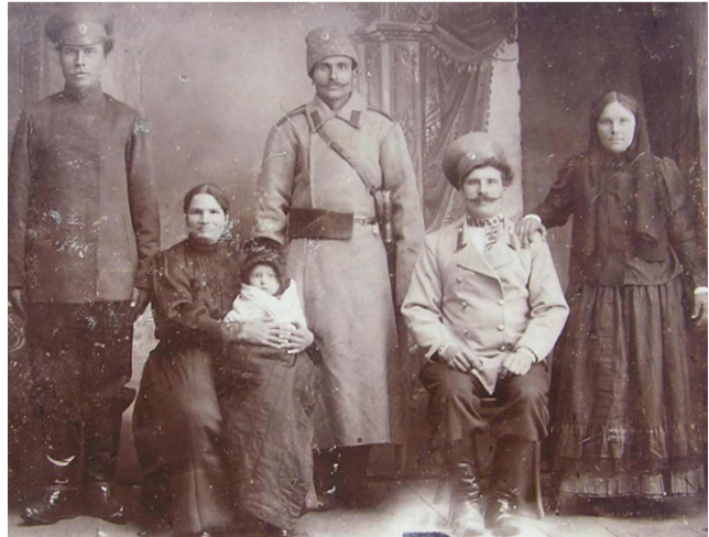
Семья хоперского казака

Служба информации редакции газеты «Казачий Кругъ» Тел. 93-17-48, e-mail: kazachy_krug@mail.ru