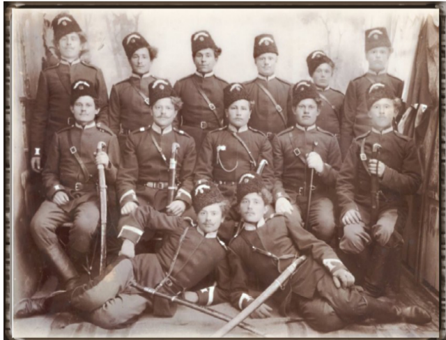
Казаки 13-го Донского казачьего полка